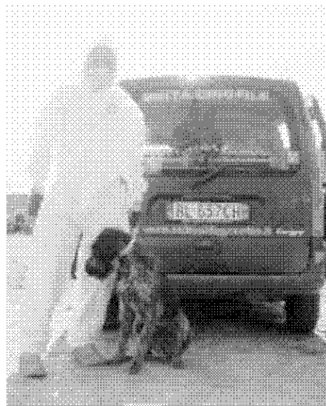
Uno degli istruttori della squadra Hbdd col cane Emma