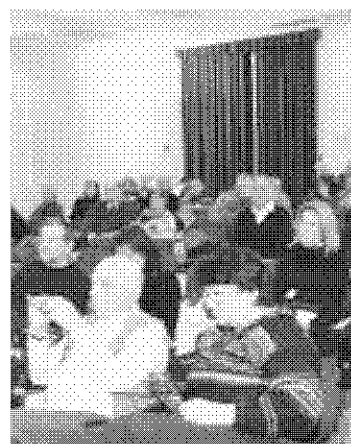
Pubblico durante Codice Armonico 2010