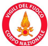
Vigili del Fuoco - Livorno