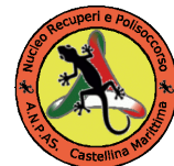
Pubblica Assistenza - Castellina M.